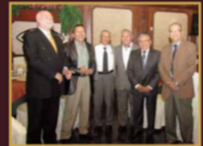
INGENIEROS ASISTENTES AL ALMUERZO DE ANIVERSARIO.