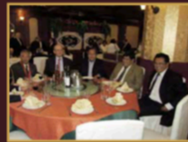
DIRECTIVOS DEL CAPITULO DE INGENIERIA DE MINAS ACOMPAÑADOS DE SUS INVITADOS.